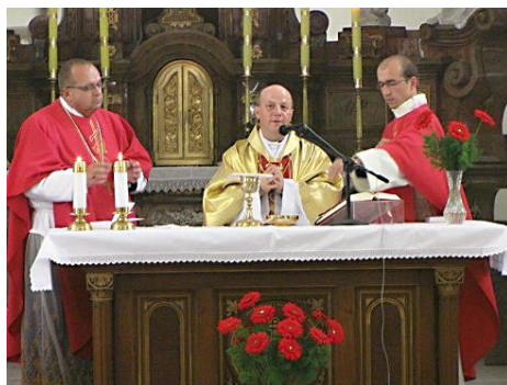
Poutní mše sv. 28.9. 2011