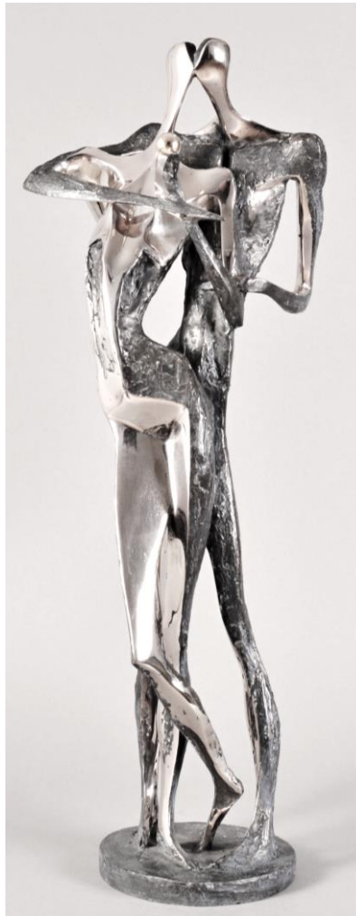
Adam a Eva (Peter Nižňanský)

Mějte si tedy, co jste chtěli! A trpte dušemi i těly a neste z dětí na děti ten mor, jež požili jste v plodu! Zhořkne vám život v nesvobodu a smrt mu půjde vzápětí.“